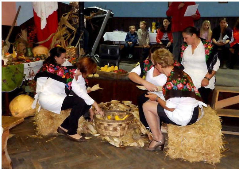
Slika 2. Lužđana u Donjim Mostima

U registru udruga Republike Hrvatske upisane su 32 udruge s područja općine Kapela iz sporta, kulture, zdravstva.